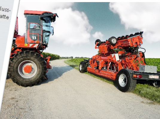
Terra Dos T3 beim Anfahren an den Roder auf dem Transportwagen.