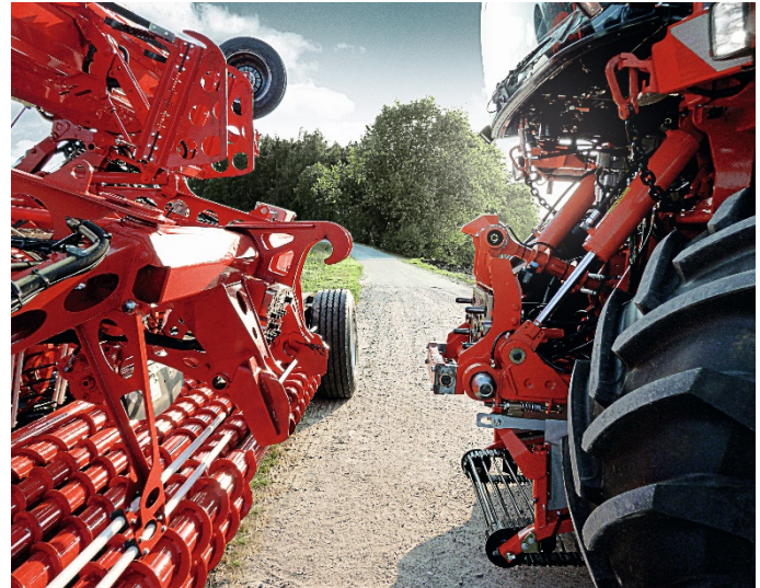
Připojení pomocí HOLMER EasyConnect.

AW: Ne, všechna připojení jsou na přípojovací desce EasyConnect, také přívod el. proudu pro reflektory!